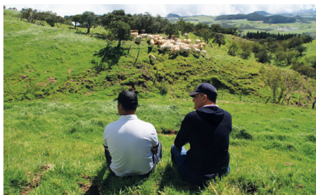
À la Plaine des Cafres dans une exploitation agricole avec un éleveur Réunionnais.