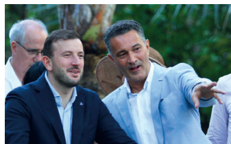
À La Réunion avec Virginijus Sinkevičius, Commissaire européen à l'Environnement, aux Océans et à la Pêche.