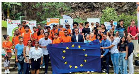
À La Réunion pendant les Erasmus Days avec les associations engagées pour la jeunesse et pour l'Europe.