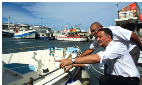
Aux côtés de nos pêcheurs au Port à La Réunion.