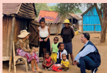
À la rencontre des habitants d'un village à Madagascar.