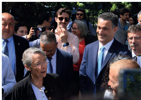
Avec la Première Ministre Elisabeth Borne à La Réunion.