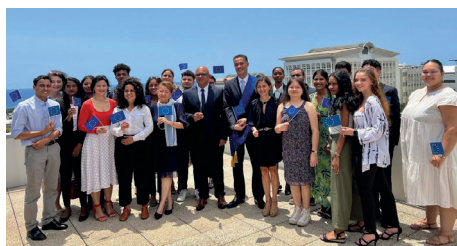
Sur le campus de l'Université de La Réunion avec les étudiants.