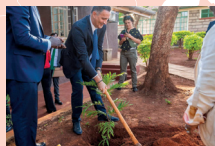
Au Kenya, plantation d'un arbre à l'occasion d'échanges sur la sécheresse et la sécurité alimentaire.