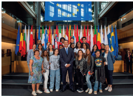
Au Parlement européen à Strasbourg avec un groupe de lycéens Réunionnais.