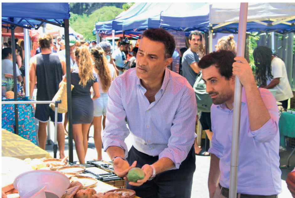
Au marché forain de Saint-Leu à La Réunion, avec le Président du groupe Renew Europe Stéphane Séjourné.