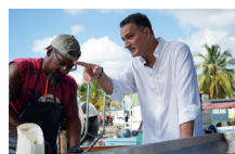
Avec les pêcheurs en Guadeloupe.