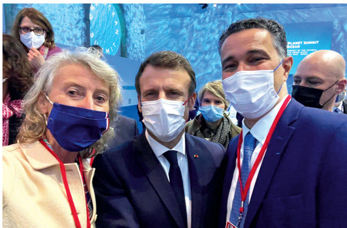
Avec le Président de la République Emmanuel Macron au Sommet One Ocean à Brest pendant la PFUE.