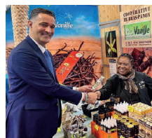
Au Salon de l'Agriculture à Paris avec les producteurs de la vanille de La Réunion.