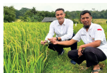
En Indonésie avec des producteurs de riz durable accompagnés par l'Europe.

MOLDAVIE - MADAGASCAR - KENYA - MOZAMBIQUE - INDONÉSIE