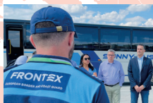
En Moldavie, au poste-frontière avec l'Ukraine aux côtés des agents Frontex

Dans ce cadre, j'ai participé à plusieurs missions pour travailler avec nos partenaires internationaux. À chaque fois, j'ai valorisé le potentiel des Outre-mer pour consolider les partenariats de l'Europe dans le Monde et construire des ponts entre les Continents.